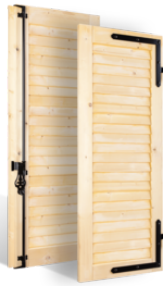
VOLETS BATTANTS 32mm à LAMES JOINTIVES en BOIS EN SAVOIR PLUS