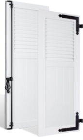
VOLETS BATTANTS 36mm à LAMES JOINTIVES AU TIERS en PVC EN SAVOIR PLUS