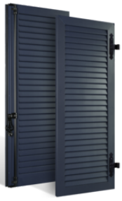
VOLETS BATTANTS 33mm à LAMES JOINTIVES en ALUMINIUM EN SAVOIR PLUS