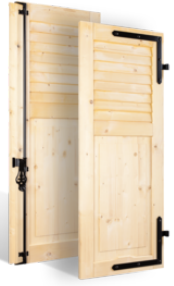
VOLETS BATTANTS 32mm à LAMES JOINTIVES AU TIERS en BOIS EN SAVOIR PLUS