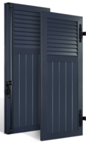
VOLETS BATTANTS 33mm à LAMES JOINTIVES AU TIERS en ALUMINIUM EN SAVOIR PLUS